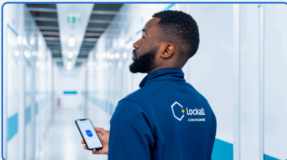
Nahtloses Facility-Management mit der One Access App

Die smarte Lösung von Sensorberg ist äußerst skalierbar, was es Lockall erleichtert, Dienstleistungen zu erweitern und weitere Einheiten hinzuzufügen, ohne dass wesentliche Änderungen an der Infrastruktur erforderlich sind. Diese Flexibilität war entscheidend für die Wachstumsstrategie von Lockall.